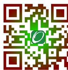
恩澤服務有限公司網頁