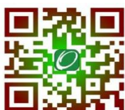
恩澤服務有限公司網頁

完成交易後煩請掃描以下奉獻 QR code 或登入 https://oasishk.org/donation_hk ，或進入本公司網頁內查看奉獻內容或填寫奉獻表格