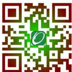
恩澤服務有限公司網頁

完成交易後煩請掃描以下奉獻QR code或登入 https://oasishk.org/donation_hk/ 或進入本公司網頁內查看奉獻內容或填寫奉獻表格